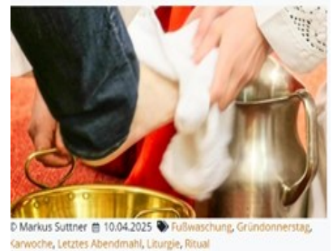
10.04.2025 Fußwaschung, Gründonnerstag, Karwoche, Letztes Abendmahl, Liturgie, Ritual

Nach der Heiligen Messe ist noch eucharistische Anbetung.