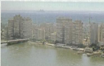
Ansicht der Hauptstadt Kairo