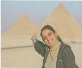
Ägyptens berühmte Pyramiden